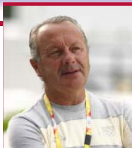
Thierry Touzaint, sélectionneur multi-médaille

Le projet sportif fédéral s'attache à valoriser les performances en mettant en place des primes selon un barème connu à l'avance. Ces primes s'adressent au cavalier, mais aussi au propriétaire du cheval et au sélectionneur de la discipline. Détails.