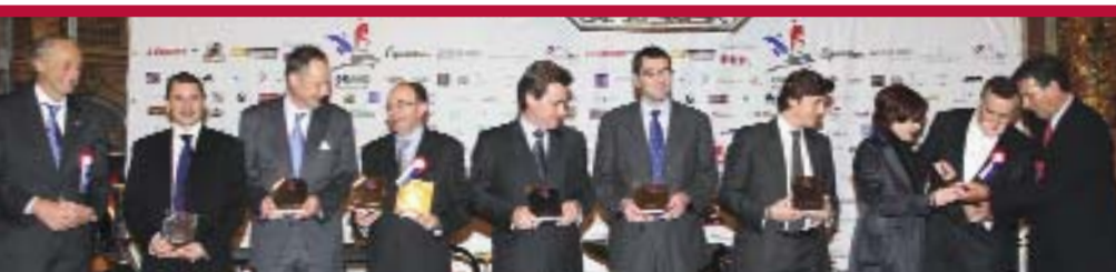
Remise de prix aux organisateurs lors du Gala Grand National - Photo : FFE/PSV

Depuis le premier janvier 2007, les actions menées en faveur du haut niveau se sont multipliées. Rappel des principales réalisations.